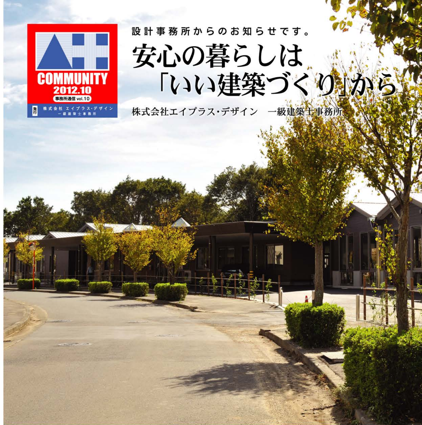
コミュニティガーデン百合が丘(2012年 設計担当 友常)