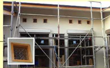
底に置かれていたフランス製のアンティークガラスを再利用。手仕事の風合いがやさしい光を室内に取り込みます。

築100年以上の既存のGUHは、古い梁や趣のある建具、古道具の宝庫でした。これらを活かしつつ、次の100年の歴史を刻む新しいお住まいを建築中です。