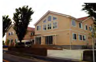
(仮称)我孫子高専賃 木造2階建、延べ床面積は約1100平米の高齢者専用賃貸住宅です。外観はピンクを基調とし、心地よさを追求したゆとりのある内装で、自宅にいるような温かみのある空間となりました。 <建設地>千葉県我孫子市(担当:龜田)