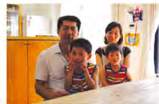
水戸市・NT様ご一家 家族構成 ご夫婦・お子様2人 竣工 2005年2月

直線的に並べた窓のおかげで風通しがよく、木のぬくもりと気持ちのいい風で子どもたちもびのび成長しています。予算に関しては、引っ越し費用などを合わせても、他の工務店やハウスメーカーさんに比べてお釣りが出るくらいに収まりました。にもかかわらず、「基礎の柱はしっかりしているし、断熱材もたくさん入っている」と大工さんが話していました。それを実感できたのは、先日起った東日本大震災の時。仕事場で感じたあの大きな揺れ、大混雑の帰路…。「家はどうなっているのか?」、「テーブルが外に飛び出しているんじゃないか?」、…不安に思いながら家に入ったのですが、ビックリしました。被害は時計や小物が2・3個落ちていたくらいで、お皿のひとつも割れていませんし、テーブル上の雑貨もそのまま無事でした。改めて頑丈な家だなと実感しました。