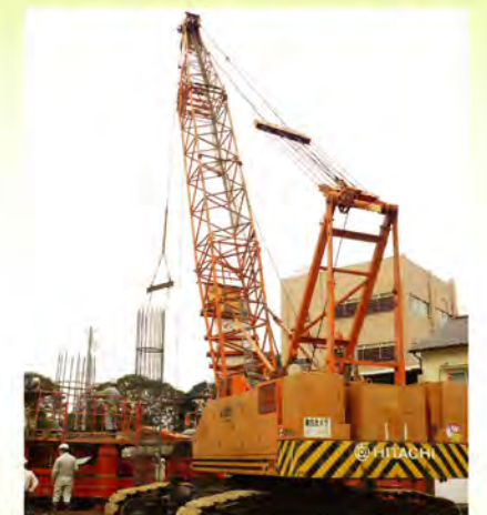
(仮)大町マンション