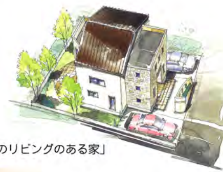
「2つのリビングのある家」